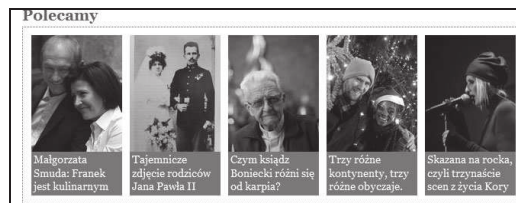
Rys. 4. Przykład dwóch poziomów anonsowania [gazetakrakowska.pl, 28.12.2011]